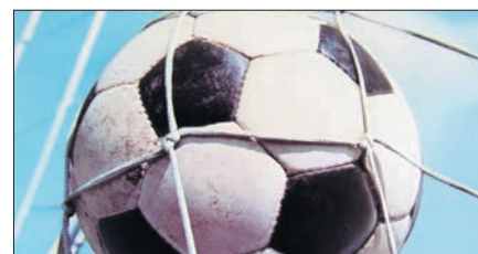
Der Fußball gehört ins Netz und nicht auf Nachbars Grundstück.

ren könne. (Oberlandesgericht des Landes Sachsen-Anhalt, Aktenzeichen 12 U 184/14)