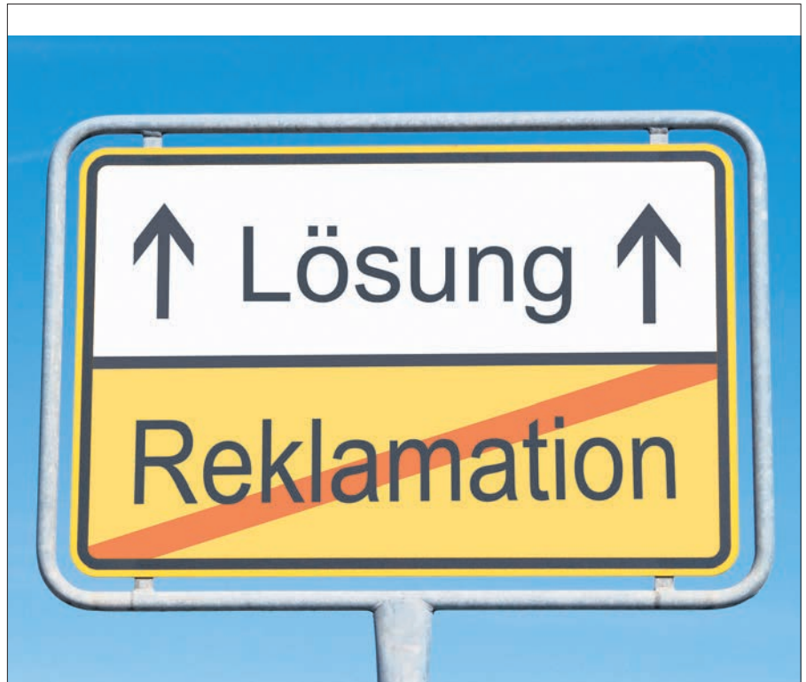
Lösungen sind gefragt, wenn die neu erworbene Ware Mängel aufweist. Manche Händler versuchen dies aber zu umgehen.

3. Bei einer Reklamation innerhalb der Gewährleistungsfrist sollte der