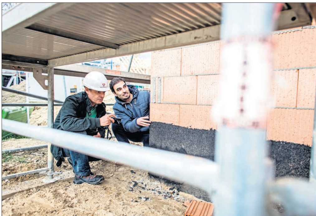
Gerade für ältere Kreditnehmer wird es derzeit immer schwieriger, bei den Banken Immobilienkredite abzuschließen.

Für alle Privatkunden mit geringem Einkommen, für junge Familien mit geringem oder auch nur einem Einkommen sowie für Rentner wird damit die Vergabe-Messlatte höher gehängt. Ältere Menschen hatten es bislang schon schwer, einen Kredit zu bekommen. Für alle, deren Darlehenslaufzeit über den Renteneintritt hi-