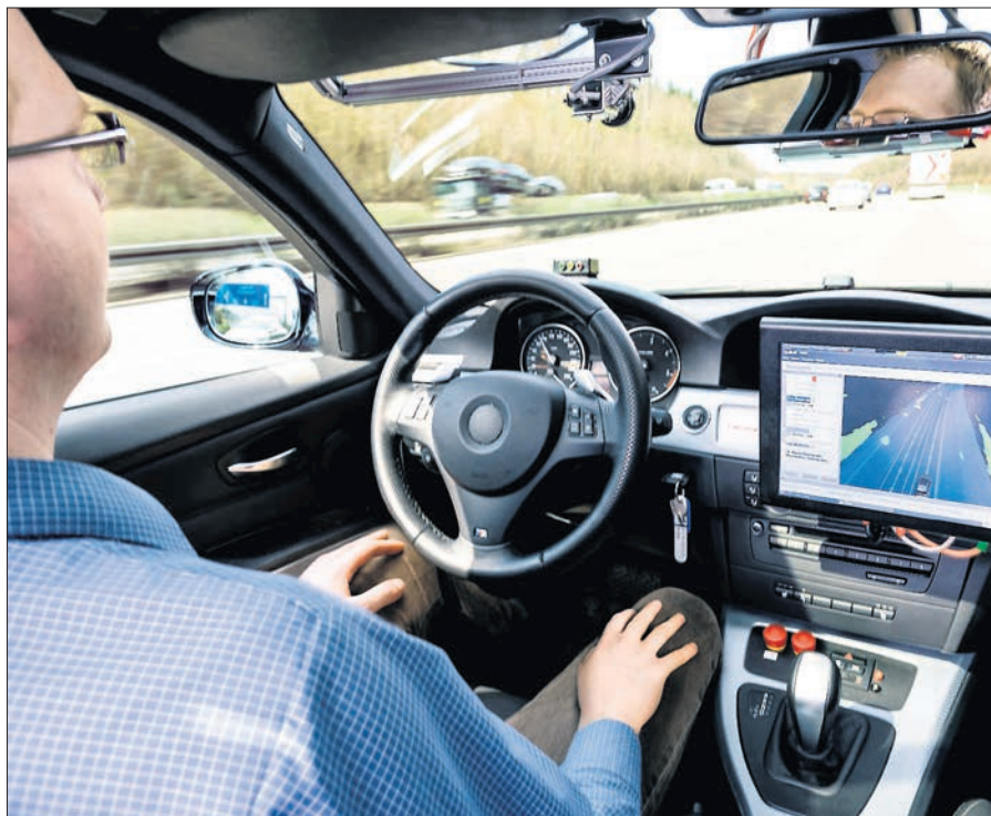
Im Auto der Zukunft kann der Fahrer das Lenken, Gasgeben und Bremsen komplett der Technik überlassen.

Das wird nicht nur die Sicherheit im Straßenverkehr, sondern auch die Faszination am Autofahren weiter erhöhen.