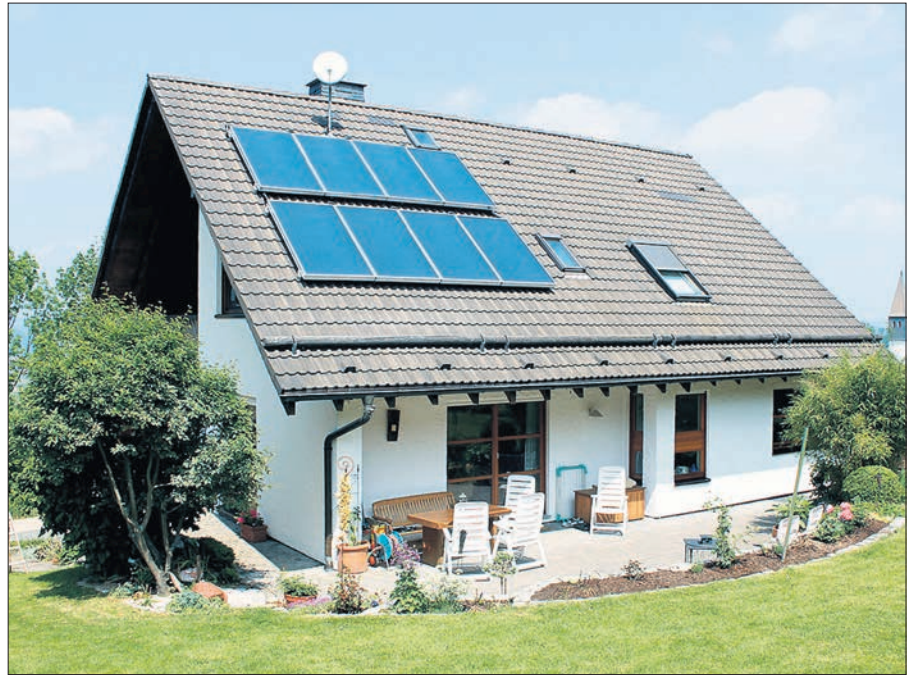
Grundsteuer: Die bisherige Bewertungsgrundlage ist veraltet und soll erneuert werden.

Bei unbebauten Grundstücken soll der gültige Bodenrichtwert herangezogen werden. Bei bebauten Grundstücken kommt noch der Gebäudewert hinzu,