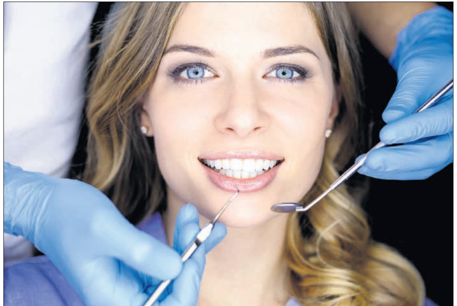
Manche Leistungen dürfen Zahnärzte bei Patienten der gesetzlichen Krankenversicherung nicht privat berechnen.

In der Praxis halten manche Orthopäden die Hand auf für die Knochendichtemessung. Die Untersuchung kann unter anderem anhand des Kalziumgehalts Aufschluss über eine Os-