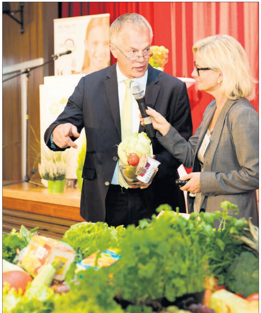
In Nordrhein-Westfalen wirbt Verbraucher-Minister Johannes Remmel für einen verantwortungsbewussten Umgang mit Lebensmitteln. Auch bei der Schulverpflegung wirbt er gemeinsam mit der Verbraucherschutzzentrale für mehr Nachhaltigkeit.

Eine App auf dem Smartphone oder die Webseite ( www.toogoodtogo ) zeigt an, in welchen Restaurants in der Nähe Essen übrig geblieben ist. Die Kunden bezahlen online und können sich dann ihr Menü vor Ort selbst zusammenstellen. Eine Box kostet rund drei Euro. Und: Man kann sie auch spenden – zum Beispiel dem Obdachlosen an der Ecke.